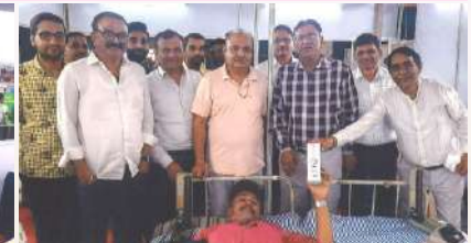
રજત જયંતિ નિમિત્તે બ્લડ ડોનેશન કેમ્પ