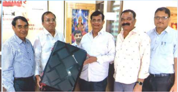
રજત જયંતિ થાપણ મુકનાર પ્રથમ સભાસદ