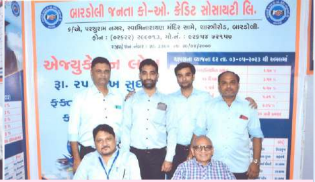
એજ્યુકેશન કેરિયર ફેર ૨૦૨૪